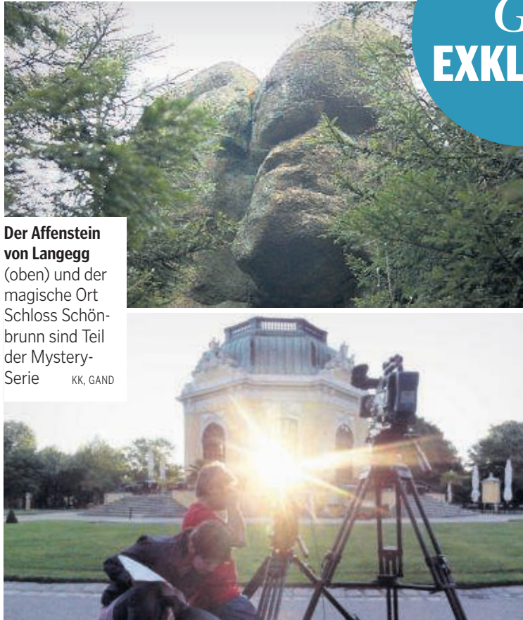
Der Affenstein von Langegg (oben) und der magische Ort Schloss Schönbrunn sind Teil der Mystery-Serie KK, GAND