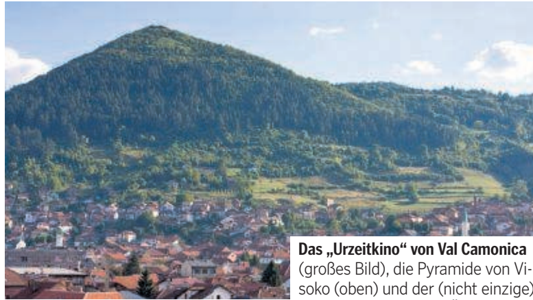
Das „Urzeitkino“ von Val Camonica (großes Bild), die Pyramide von Visoko (oben) und der (nicht einzige) ungelöste Mumienfall Österreichs (unten) GIARELLI, JAGESEVIC, KK