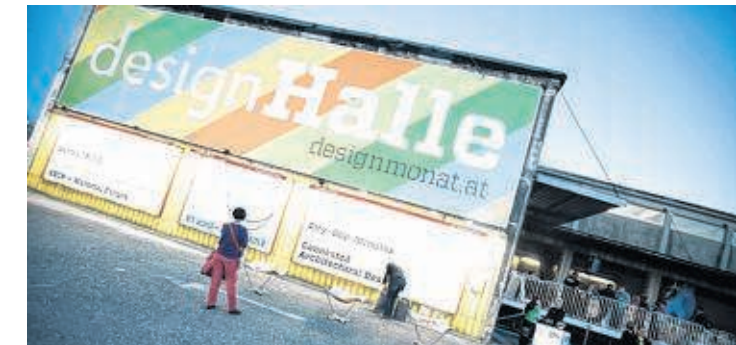
Nach dem Designmonat soll die Designhalle weiter genützt werden

Noch bis nächsten Sonntag besetzt der Designmonat Graz eine Lagerhalle am Lazarettgürtel: die Designhalle. „Die Location ist super“, sagt Creative-Industries-Chef Eberhard Schrempf. Mehr als 3000 Besucher in drei Wochen hätten die Ausstellungen und Events gegenüber dem Citypark besucht. „Ich würde es bedauern, wenn wir die Halle nicht halten könnten.“ Schrempf und Citypark-Centermanager Waldemar Zelinka wollen nach dem Designmonat Strategien für die 2000 m 2 große Halle entwickeln. Schrempf: „Eine ganzjährige Nutzung ist nicht vorgesehen.“ Auch vorstellbar: Werkräume oder Ateliers einzurichten. JULIA SCHAFFERHOFF