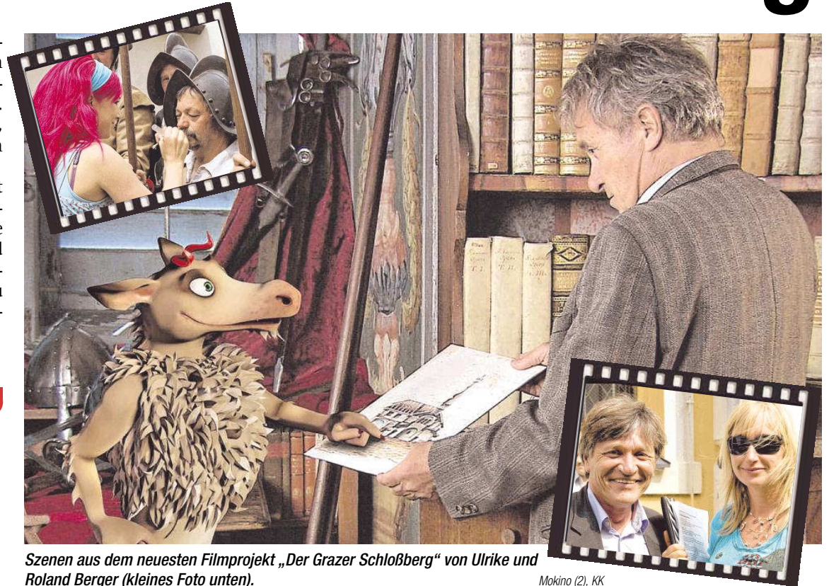
Szenen aus dem neuesten Filmprojekt „Der Grazer Schloßberg“ von Ulrike und Roland Berger (Kleines Foto unten).