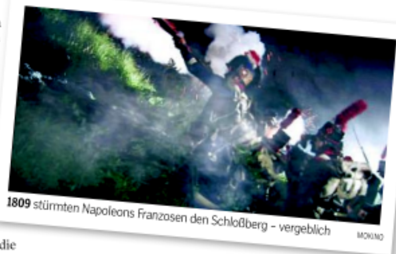
1809 stürmten Napoleons Franzosen den Schloßberg – vergeblich

Vor Drehbeginn ruft Berger die Bevölkerung noch zur Mithilfe auf: „Wir haben gehört, dass es noch Bild- und Filmmaterial vom Schloßberg aus der Zeit der 1920er- und 1930er-Jahre gibt. Wir würden uns über Material sehr freuen.“ Info-Tel: (0 316) 225 140