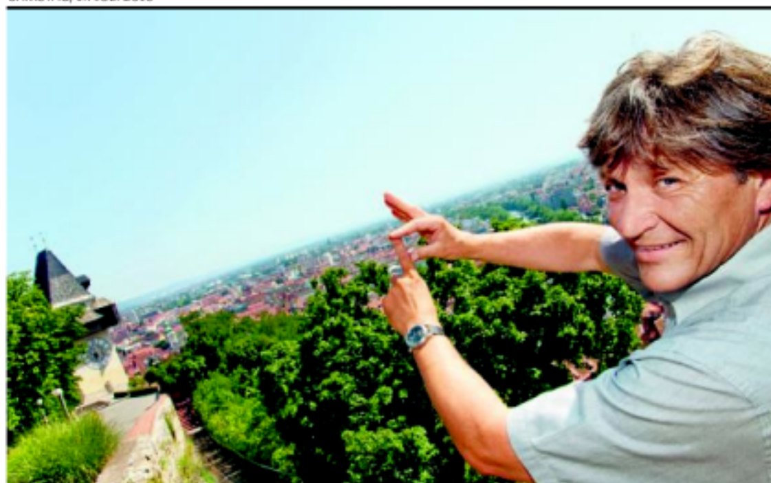
Roland Berger rückt die Geschichte des Schloßbergs ins Rampenlicht und sucht dafür Archivmaterial